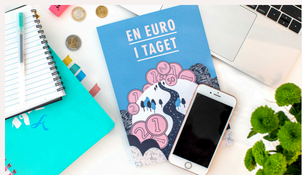
Första upplagan av En euro i taget distribuerades i 3 500 ex. Boken var illustrerad av Johanna Hägväg och för grafik stod Magnus Lindroos. Text av Marina Nygård och Mia-Maja Wägar.

Materialen har gjort det möjligt att förlänga projektets räckvidd bortom själva föreläsningstillfällena och gett deltagarna något att återvända till också efteråt. Innehållet har kontinuerligt utvecklats utifrån ungas behov och aktuella samhällsförändringar.